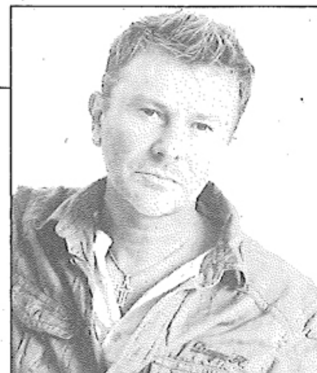
Ron, alle 17 atteso alla Fnac in serata in concerto al Bellini con l'Orchestra Toscana Jazz